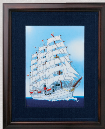
32. 帆船・陶額 88,000円(税込) 1900-MK4／縦52×横42.5cm