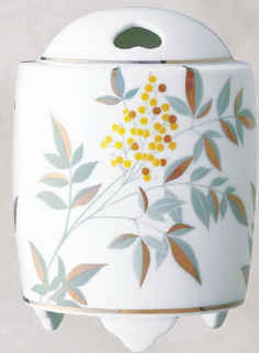
43. 燦彩南天・香炉 16,500円(税込) 1096-PFC／高12.5cm、木箱入