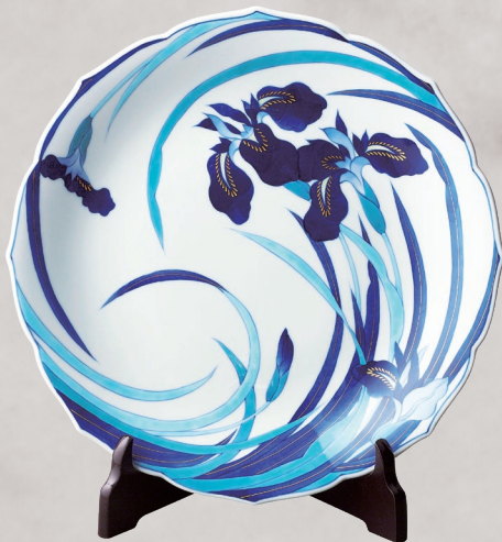
27. 染錦菖蒲・飾り皿 88,000円(税込) 851-MB10／径31cm、皿立て付、木箱入

桃山時代の屏風に描かれた花車に、花籠をのせたデザインです。牡丹、菊、萩、藤を緻密に描き込んで、色彩豊かに仕上げた香蘭社調の豪華な作品です。