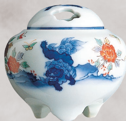
42. 唐獅子・香炉 38,500円(税込) 837-PED／高7cm、木箱入