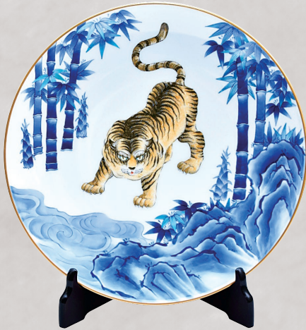
25. 染錦竹寅文・飾り皿 385,000円(税込) 1645-MD10／径30cm、皿立て付、木箱入

染付で描かれた竹や岩のダイナミックな表現と、上絵付により1本1本繊細に描き込んだ虎の毛並みの表現の対比が見どころです。職人の丹念な手仕事で、丁寧な仕上げられた飾り皿です。