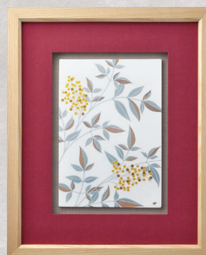
37. 燦彩南天・陶額 41,800円(税込) 1096-MK2／縦44×横36cm