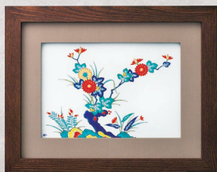
33. 色絵岩菊・陶額 55,000円(税込) 694-MK2／縦30.5×横39cm