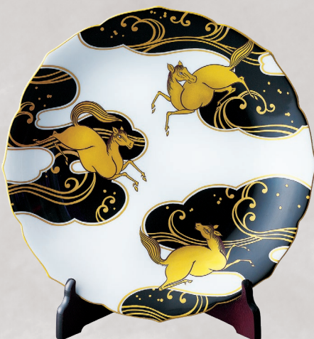
29. 黒金彩遊馬文・飾り皿 33,000円(税込) 644-MB10／径31cm、皿立て付、木箱入