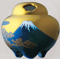
41. 富士絵・香炉 33,000円(税込) R836-PED／高7cm、木箱入

明治初期の有田の代表的なパターンから引用してデザインしたもので、芙蓉花を中心に季節を感じる草花を配し、繊細で実に巧みに描かれています。