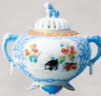
39. 染錦唐草遊犬の図・環付香炉 220,000円(税込) 6011-PFE／高14cm、木箱入

染付を主にして全面に唐草文を、測と高台には地紋を配しています。鍋島様式の香炉で、落ち着いた雰囲気を持つ作品です。