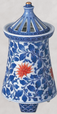
38. 染錦唐草文・傘型香炉 253,000円(税込) 845-PED／高15.5cm、木箱入

染付を主にして全面に唐草文を、測と高台には地紋を配しています。鍋島様式の香炉で、落ち着いた雰囲気を持つ作品です。