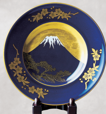
30. 富士絵・飾り皿 15,400円(税込) R836-MPL／径18.5cm、皿立て付