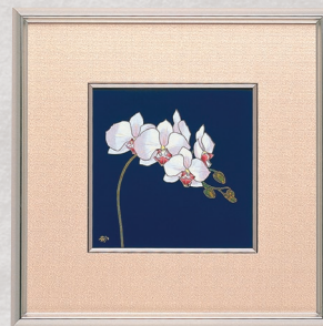
36. ルリ胡蝶蘭・陶額 55,000円(税込) R1202-MK1／縦36×横36cm