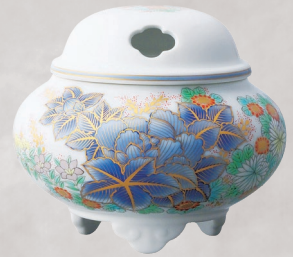
40. 染錦芙蓉淡彩菊・香炉 77,000円(税込) 859-PF2／高9cm、木箱入

明治初期の作品に描かれたデザインです。小菊の咲いた庭で、子犬がじゃれあって遊んでいる様子を繊細に描いた、ほのぼのとした作品です。