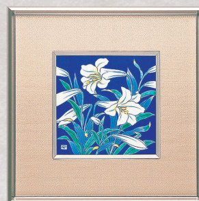
34. 百合・陶額 55,000円(税込) N671-MK1／縦36×横36cm