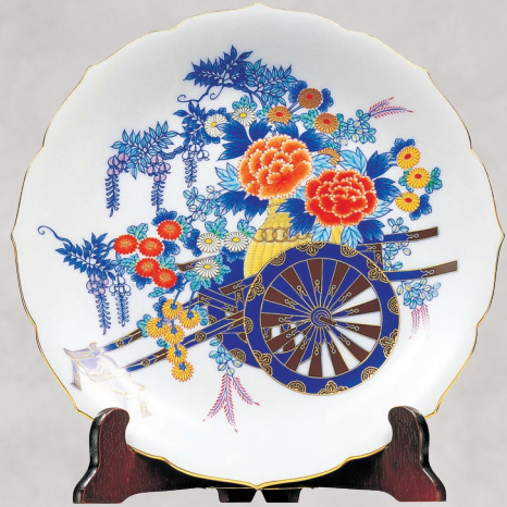
26. 染錦花車・飾り皿 275,000円(税込) 916-MB10／径31cm、皿立て付、木箱入

染付で描かれた竹や岩のダイナミックな表現と、上絵付により1本1本繊細に描き込んだ虎の毛並みの表現の対比が見どころです。職人の丹念な手仕事で、丁寧な仕上げられた飾り皿です。