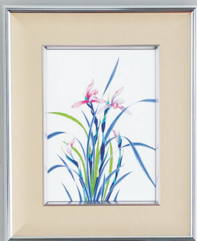
35. 春蘭・陶額 93,500円(税込) 192-MK4／縦52×横42cm