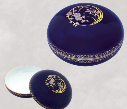
46. ルリ金彩梅春蘭・ボンボニエール 11,000円(税込) R3005-QJ／径8cm、木箱入