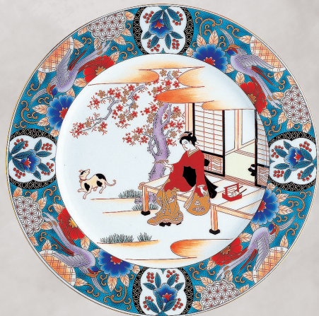
28. 元禄美人画(縁先)・飾り大皿 55,000円(税込) 896-JA12／径31cm