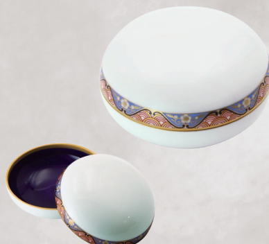
45. 割絵地紋・ボンボニエール 16,500円(税込) 1573-QJ／径8cm、木箱入