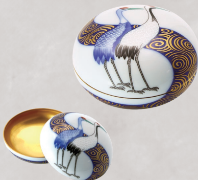
44. 光琳鶴・ボンボニエール 22,000円(税込) 930-QJ／径8cm、木箱入