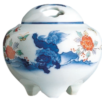
45. 唐獅子・香炉 38,500円(税込) 837-PED / 高7cm、木箱入