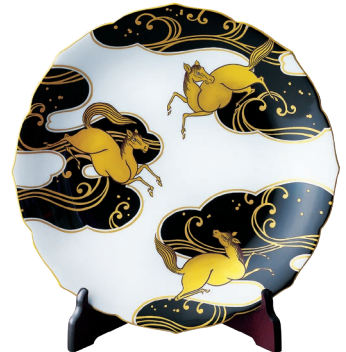
50. 黒金彩遊馬文・飾り皿 33,000円(税込) 644-MB10 / 径31cm、皿立て付、木箱入