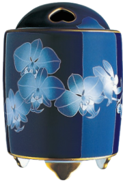
42. ルリ胡蝶蘭・香炉 16,500円(税込) R1202-PFC / 高12.5cm、木箱入