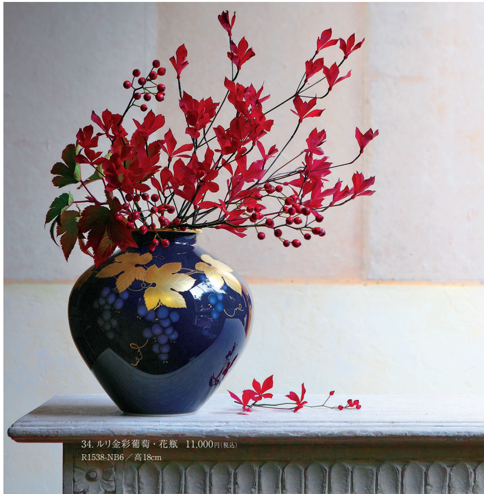
34. ルリ金彩葡萄・花瓶 11,000円(税込) R1538-NB6 / 高18cm