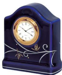
61. orchid wave・置時計 16,500円(税込) R1308-TOS / 高11cm