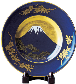
48. 富士絵・飾り皿 15,400円(税込) R836-MPL / 径18.5cm、皿立て付