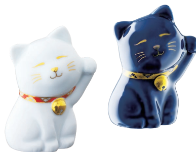
55. まねき猫・置物 7,700円(税込) 2983-PY / 高8cm 56. ルリまねき猫・置物 7,700円(税込) R2983-PY / 高8cm