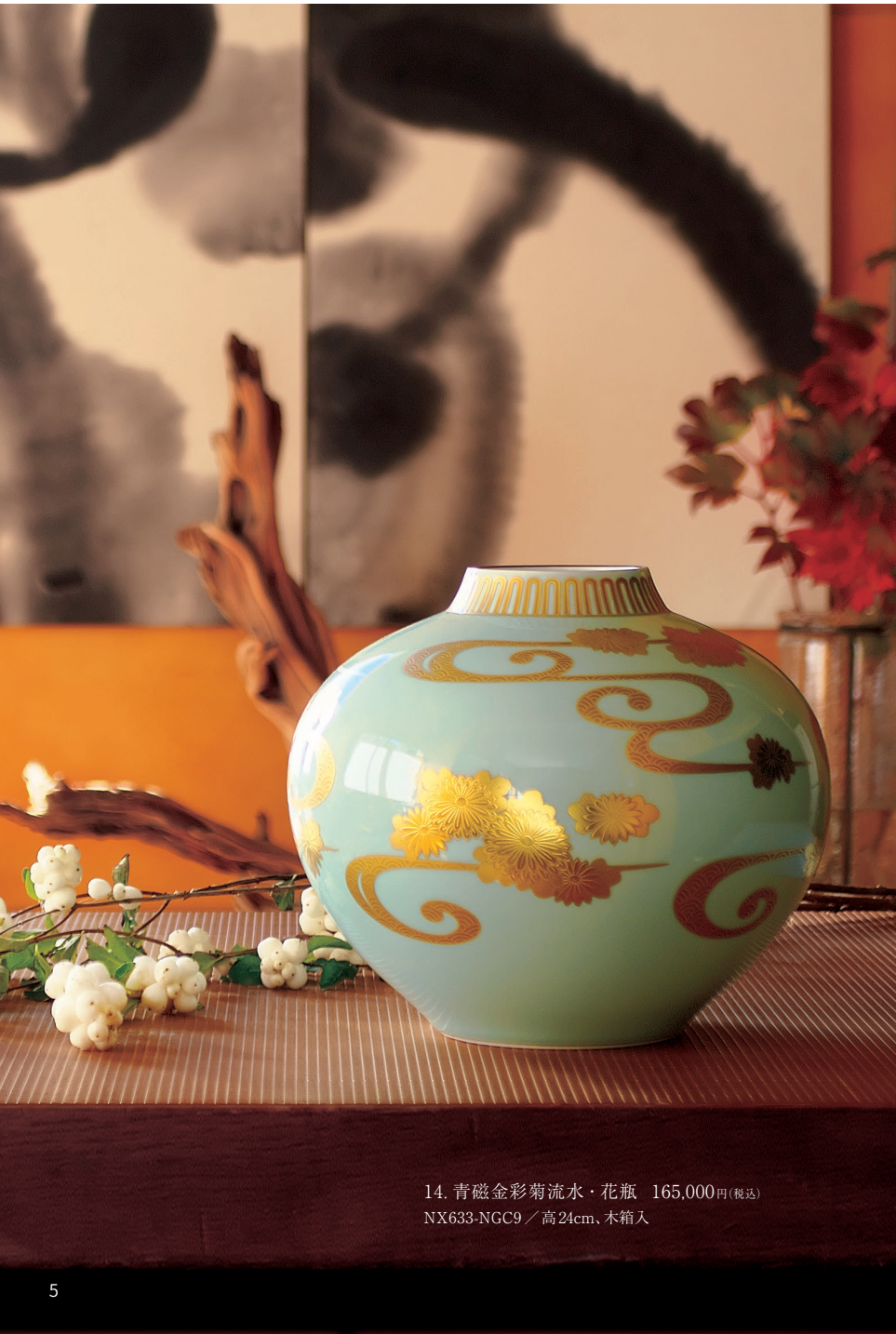
14. 青磁金彩菊流水・花瓶 165,000円(税込) NX633-NGC9 / 高24cm、木箱入