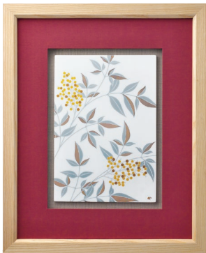
38. 燦彩南天・陶額 41,800円(税込) 1096-MK2 / 縦44×横36cm