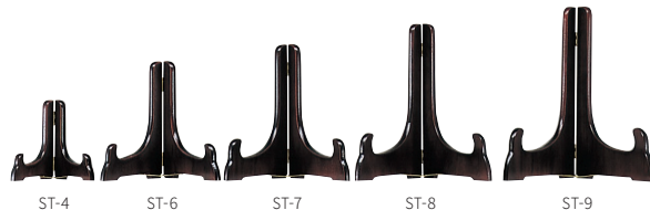
[皿立て] 68. ST-4 / 高11.5cm 1,320円(税込) 71. ST-8 / 高24.5cm 2,420円(税込) 69. ST-6 / 高18cm 1,650円(税込) 72. ST-9 / 高27cm 2,750円(税込) 70. ST-7 / 高20.5cm 1,980円(税込)