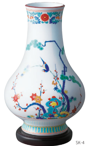
15. 蔦・花瓶 66,000円(税込) 102-NA9 / 高27cm、木箱入