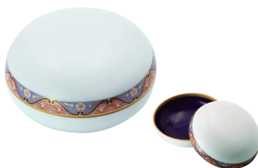
58. 割絵地紋・ボンボニエール 16,500円(税込) 1573-QJ / 径8cm、木箱入