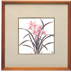
35. 蘭・陶額 19,800円(税込) 191-MKB / 縦27.5×横27.5cm