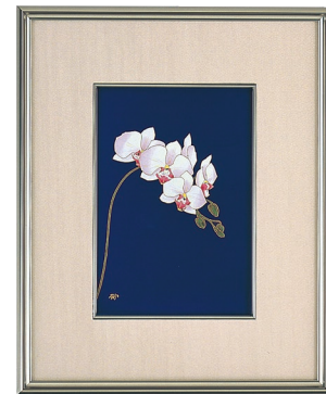
39. ルリ胡蝶蘭・陶額 66,000円(税込) R1202-MK2 / 縦44×横36cm