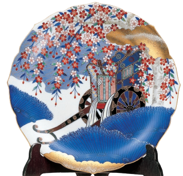
53. 染錦御所車・飾り皿 880,000円(税込) 118-MB10 / 径31cm、皿立て付、木箱入