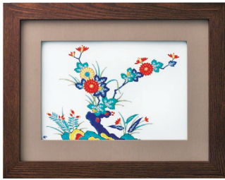
36. 色絵岩菊・陶額 55,000円(税込) 694-MK2 / 縦30.5×横39cm