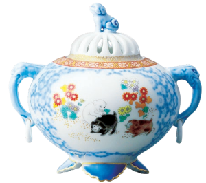
47. 染錦唐草遊犬の図・環付香炉 220,000円(税込) 6011-PFE / 高14cm、木箱入