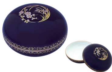
57. ルリ金彩梅春蘭・ボンボニエール 11,000円(税込) R3005-QJ / 径8cm、木箱入