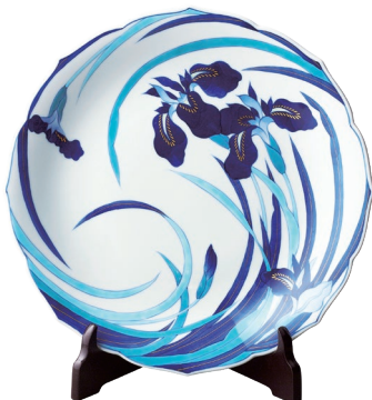
51. 染錦菖蒲・飾り皿 88,000円(税込) 851-MB10 / 径31cm、皿立て付、木箱入