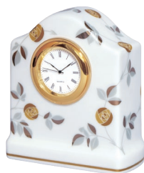
60. 燦彩ばら・置時計 16,500円(税込) 1069-TOS / 高11cm