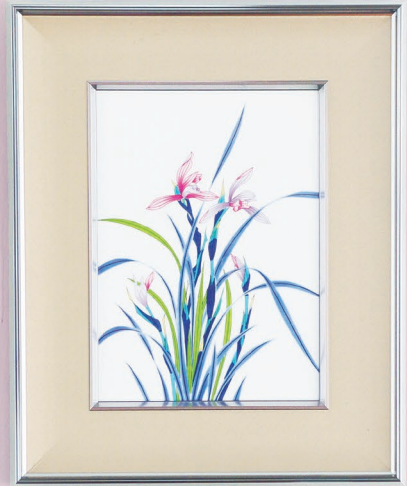
37. 春蘭・陶額 93,500円(税込) 192-MK4 / 縦52×横42cm