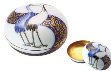
59. 光琳鶴・ボンボニエール 22,000円(税込) 930-QJ / 径8cm、木箱入