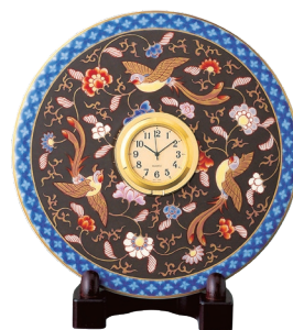
62. 測地黒絵花鳥紋・時計 22,000円(税込) 520-TT / 径14cm、台付