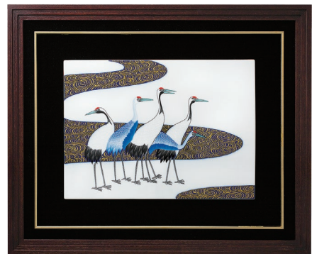
41. 光琳鶴・陶額 110,000円(税込) 930-MK4 / 縦44×横53.5cm