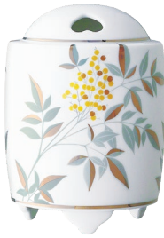
43. 燦彩南天・香炉 16,500円(税込) 1096-PFC / 高12.5cm、木箱入