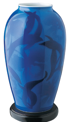
24. 白磁ダイヤ・花瓶 22,000円(税込) 299-NWR / 高27cm、木箱入