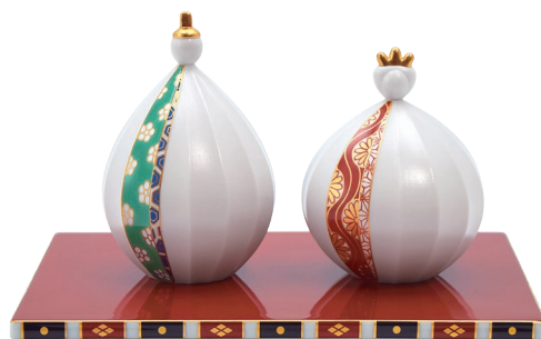
54. 和地紋・ひな人形 27,500円(税込) 843-PA4 / 男雛:高9cm、女雛:高8cm 台座:幅18×奥行13×高0.6cm