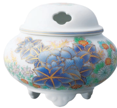
46. 染錦芙蓉淡彩菊・香炉 77,000円(税込) 859-PF2 / 高8.5cm、木箱入