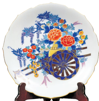
52. 染錦花車・飾り皿 275,000円(税込) 916-MB10 / 径31cm、皿立て付、木箱入