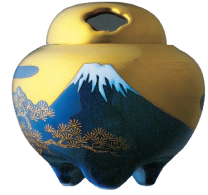
44. 富士絵・香炉 33,000円(税込) R836-PED / 高7cm、木箱入