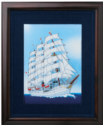
40. 帆船・陶額 88,000円(税込) 1900-MK4 / 縦52×横42.5cm