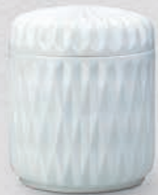
30. ダイヤカット <299-KJS>

千姿百態、自然の景観は時代を越えて愛され、見る人に安らぎを与えてくれます。白磁と呉須のコントラストが美しい飽きのこないデザインです。