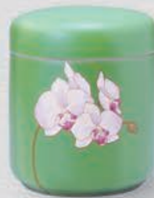
33. グリーン胡蝶蘭 <G1202-KJS>

「ロイヤルブルー」と呼ばれる香蘭社独自の瑠璃釉を施した、清楚で気品のある胡蝶蘭の花姿が映えるデザインです。