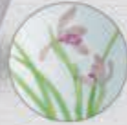
6. 春蘭 <1228-KJBL>