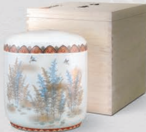
9. 金彩竹林文 <6015-KJLN>