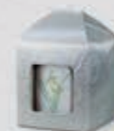
5・6寸骨壺に対応(白・緑・青)