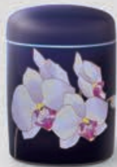
38. ルリ胡蝶蘭 <R1202-KJT3>