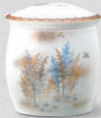
16. 金彩竹林文 <6015-KJB>

明治後期の香蘭社を代表する図柄であり、写実を重視した描法は竹林を揺らす風の音さえも描き出しています。