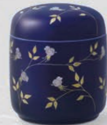
25. ルリ薔薇 <R325-KJM>

「ロイヤルブルー」と呼ばれる香蘭社独自の深みのある瑠璃釉を施し、全面に金彩の薔薇を配した豪華で気品のあるデザインです。