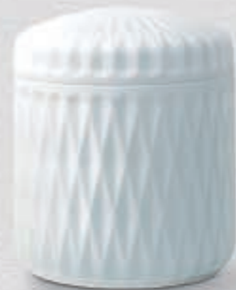
22. ダイヤモンドカット <299-KJM>

凛とした白さの中に清潔感あふれる白磁、全面に施されたダイヤモンドカットの美しい陰影が純白な白磁の魅力を引き出してくれます