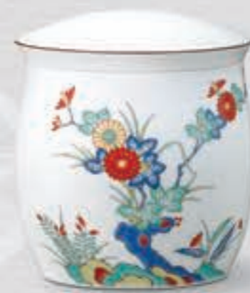
18. 色絵岩菊 <694-KJB>

古伊万里調の豪華な色彩で、龍や鳳凰、山水などの吉祥文様をバランス良く配しています。繊細なタッチと白磁の空間が生きた格調高いデザインです。