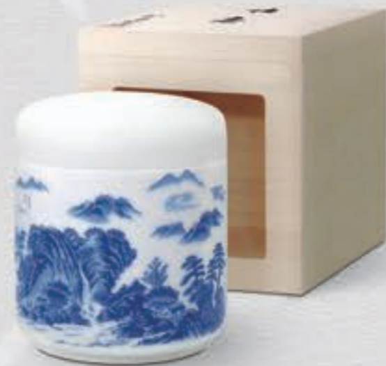
29. 山水 <2053-KJS>

千姿百態、自然の景観は時代を越えて愛され、見る人に安らぎを与えてくれます。白磁と呉須のコントラストが美しい飽きのこないデザインです。