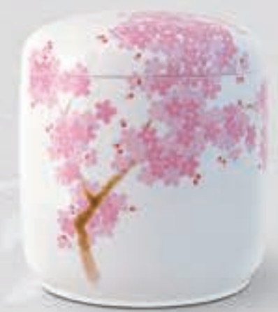
15. 吉野桜 <1142-KJLN>