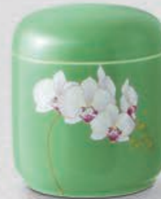
24. グリーン胡蝶蘭 <G1202-KJM>

凛とした白さの中に清潔感あふれる白磁、全面に施されたダイヤモンドカットの美しい陰影が純白な白磁の魅力を引き出してくれます