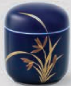
41. ルリ金蘭 <R405-KJSS>

「ロイヤルブルー」と呼ばれる香蘭社独自の深みのある瑠璃釉に、伸びやかに描かれた金彩の蘭の佇まいが気品を感じさせます。