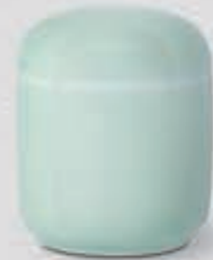
46. 青磁 <NX410-KJSS>