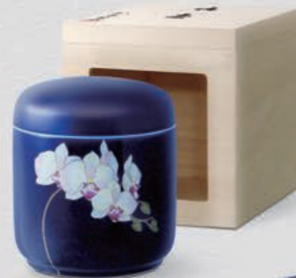
23. ルリ胡蝶蘭 <R1202-KJM>