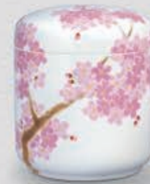
36. 吉野桜 <1142-KJS4>

透き通るような美しい白磁にスケッチから生まれた春蘭の絵柄を伸びやかに、そして生き生きと表現しました。香蘭社らしい気品を感じるデザインです。