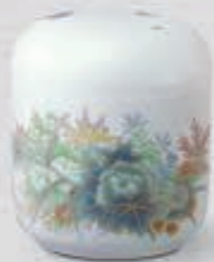
42. 芙蓉淡彩菊 <6017-KJSS>

「ロイヤルブルー」と呼ばれる香蘭社独自の深みのある瑠璃釉に、伸びやかに描かれた金彩の蘭の佇まいが気品を感じさせます。