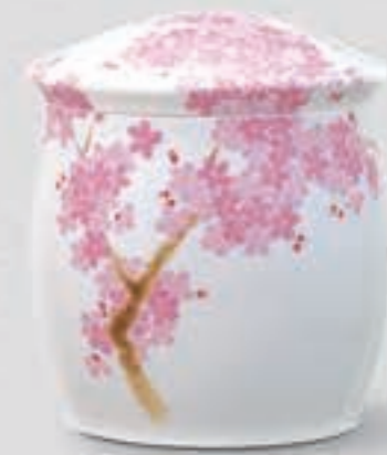
19. 吉野桜 <1142-KJB>

香蘭社のデザイン帳から引用した文様の、構図と色調をアレンジして制作し、柿右衛門調に仕上げました。有田焼らしい色彩と空間の美を感じます。