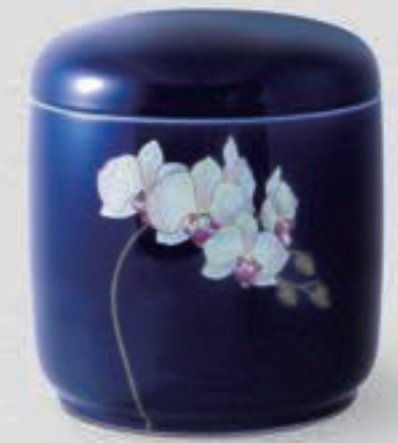
13. ルリ胡蝶蘭 <R1202-KJLN>