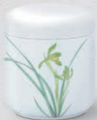
31. 春蘭 <1228-KJS>