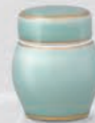
51. 青磁金線 <NX410-KJSK>