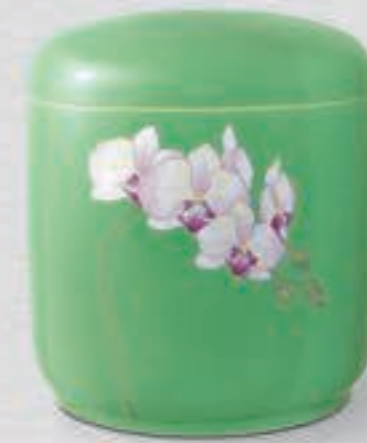
12. グリーン胡蝶蘭 <G1202-KJLN>