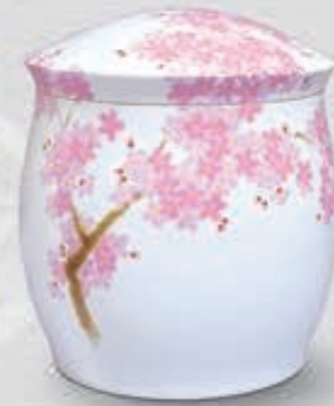
7. 吉野桜 <1142-KJBL>