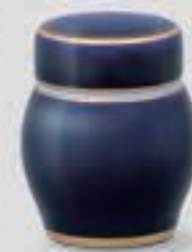
50. ルリ金線 <R410-KJSK>

明治期の図案を復刻したもので、芙蓉花を中心に草花を配し、細部まで繊細な筆致で描かれた格調高いデザインです。