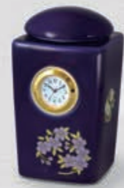
49. ルリ花丸紋 <R3003-KJTP>