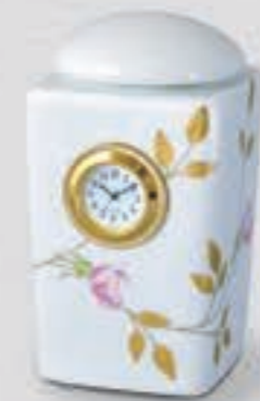
48. ばら <325-KJTP>