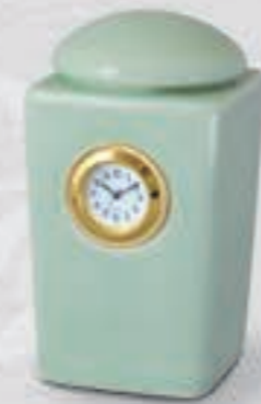
47. 青磁 <NX410-KJTP>