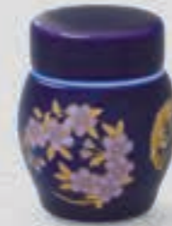
54. ルリ花丸紋 <R3003-KJSK>