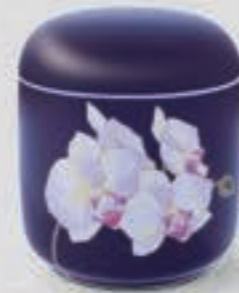
45. ルリ胡蝶蘭 <R1202-KJSS>