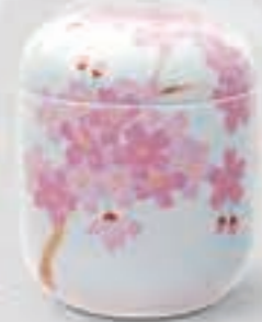
44. 吉野桜 <1142-KJSS>