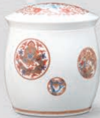
17. 色絵吉祥丸紋 <6014-KJB>

明治後期の香蘭社を代表する図柄であり、写実を重視した描法は竹林を揺らす風の音さえも描き出しています。