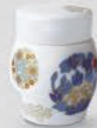
53. 金ミル花丸紋 <757-KJSK>