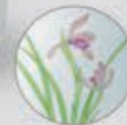
14. 春蘭 <1228-KJLN>