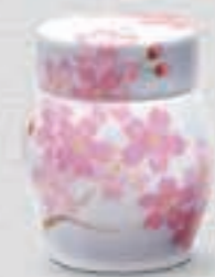
52. 吉野桜 <1142-KJSK>