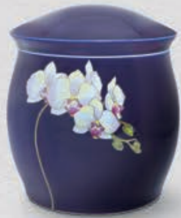
5. ルリ胡蝶蘭 <R1202-KJBL>