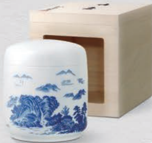
20. 山水 <2053-KJM>