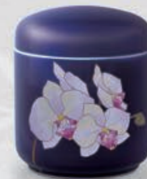
37. ルリ胡蝶蘭 <R1202-KJS4>