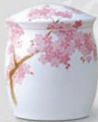
28. 吉野桜 <1142-KJBS>