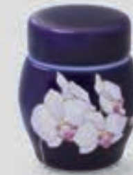
56. ルリ胡蝶蘭 <R1202-KJSK>