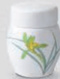
55. 春蘭 <1228-KJSK>