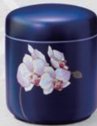
32. ルリ胡蝶蘭 <R1202-KJS>

「ロイヤルブルー」と呼ばれる香蘭社独自の瑠璃釉を施した、清楚で気品のある胡蝶蘭の花姿が映えるデザインです。