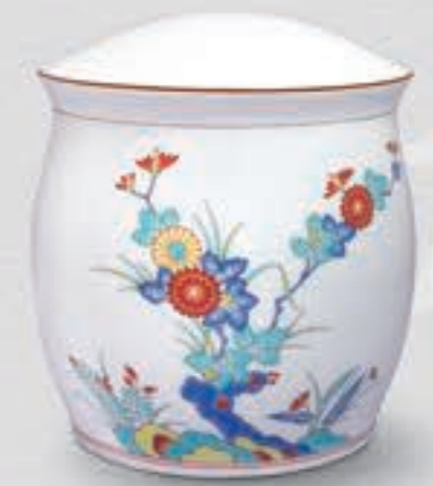
8. 色絵岩菊 <694-KJBL>