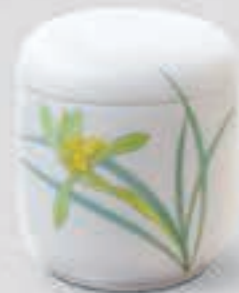
43. 春蘭 <1228-KJSS>