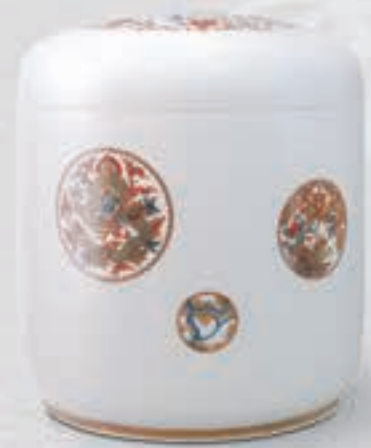
10. 色絵吉祥丸紋 <6014-KJLN>