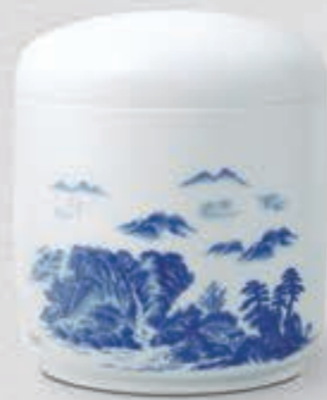
11. 山 水 <2053-KJLN>