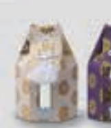
2.5寸骨壺に対応(金・紫)