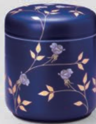
34. ルリ薔薇 <R325-KJS>