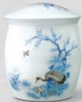
26. 染付鶴梅花文 <6016-KJBS>

梅樹の下に佇む鶴の群像を繊細な筆致で表現しています。水墨画を思わせる筆使いの的確な描写が際立つデザインです。