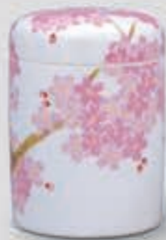
39. 吉野桜 <1142-KJT3>