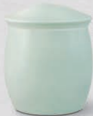
27. 青磁 <NX410-KJBS>

梅樹の下に佇む鶴の群像を繊細な筆致で表現しています。水墨画を思わせる筆使いの的確な描写が際立つデザインです。