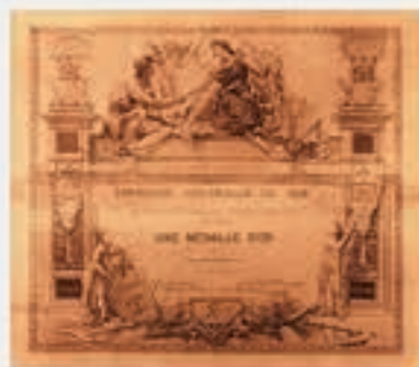
1878年 パリ万国博覧会 金牌賞状