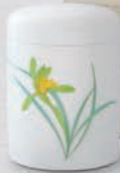
40. 春蘭 <1228-KJT3>