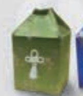
3・4寸骨壺に対応(緑・青)