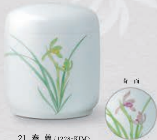
21. 春蘭 <1228-KJM>